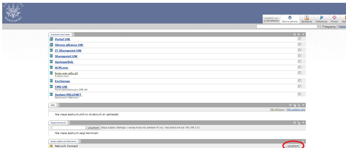
Rysunek 2. Uruchamianie aplikacji Network Connect.